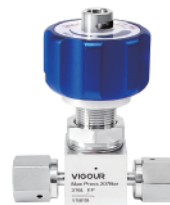
1/4" 手动型 (带锁)